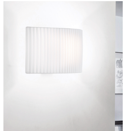
Photography does not show US mounting. La fotografía no muestra el montaje de Norteamérica.