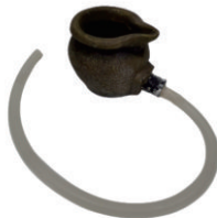
B. Dessus de la fontaine (1x)