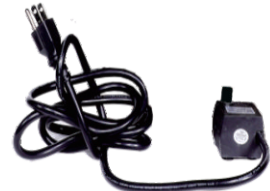
C. Pompe submersible (1x)