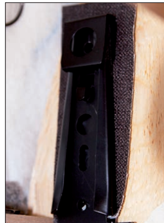
Dos installé. Installed back.

Ensure that back clip is properly aligned with the anchoring of the base on both sides of your chair or sofa until it clicks.