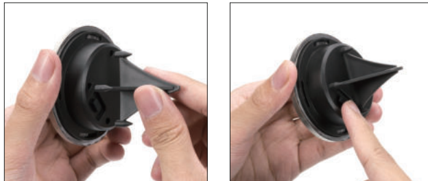
③ Install the base onto the light. ④ Move the switch to "ON" position.