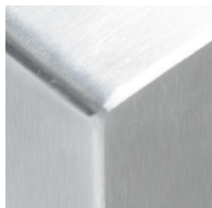
Stainless steel (ST)