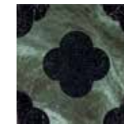
4101204 PIN GREEN_BLACK