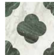
4101196 PIN WHITE_GREEN