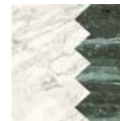
4101197 COMB WHITE_GREEN