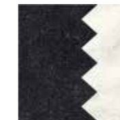
4101201 COMB BLACK_WHITE