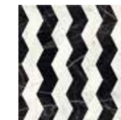
*4101202 RIBBON BLACK_WHITE

*HA UN VERSO DI POSA - A SPECIFIC INSTALLATION SIDE IS REQUIRED