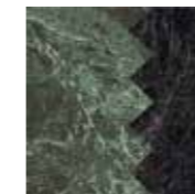
4101205 COMB GREEN_BLACK