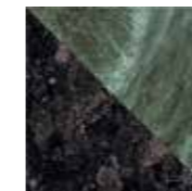
4101203 FLAG GREEN_BLACK