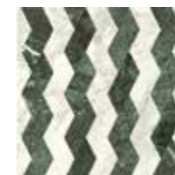
*4101198 RIBBON WHITE_GREEN