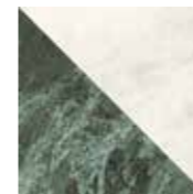
4101195 FLAG WHITE_GREEN