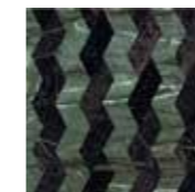
*4101206 RIBBON GREEN_BLACK