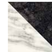
4101199 FLAG BLACK_WHITE