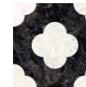
4101200 PIN BLACK_WHITE