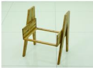
4. 取出柜脚右用短螺丝安装