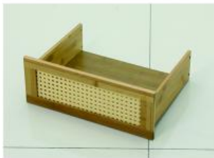
10. 取出抽屉底板沿凹槽插入