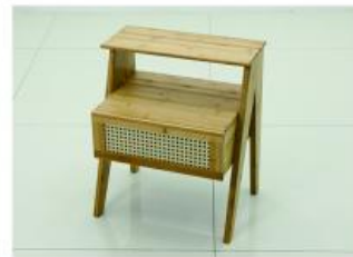
12. 最后插入抽屉即可