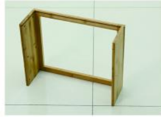
2. 取出侧边挡板右用长螺丝安装 (注意支架和层板凹槽对齐)