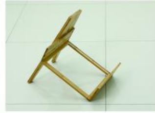
3. 取出柜脚左用短螺丝安装