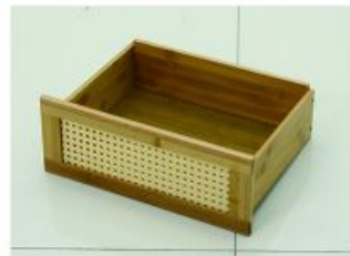
11. 取出抽屉后挡板用短螺丝安装