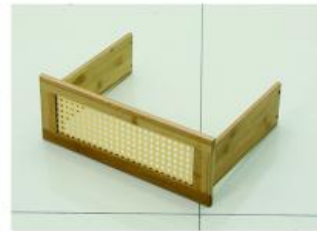
9. 取出抽屉前挡板以及抽屉侧挡板用短螺丝按安装