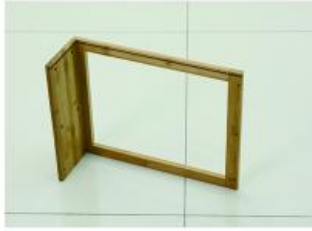
1. 取出底部层板以及侧边挡板左用长螺丝安装 (注意层板凹槽对齐)