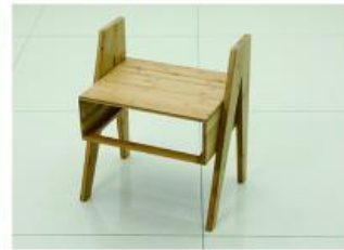
6. 取出大顶部层板用长螺丝安装