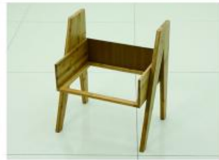
5. 取出背板沿凹槽插入