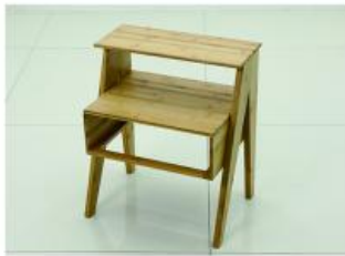
7. 取出小顶部层板用长螺丝安装