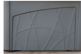
Panel de la puerta