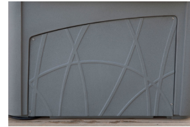
Panneau de porte