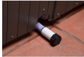
Vanne de vidange