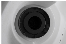
Compartimiento del filtro