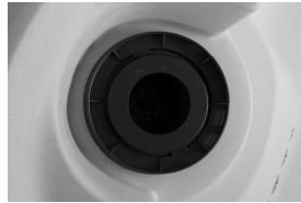
Compartiment du filtre