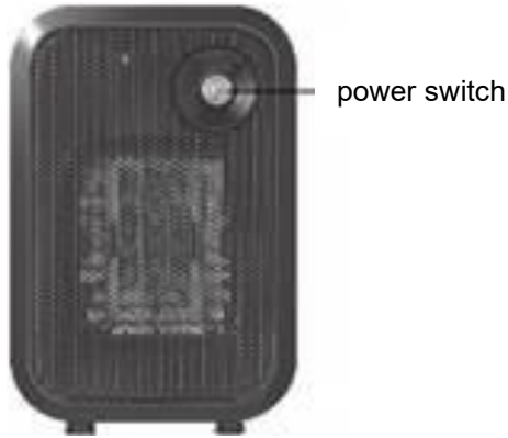
Fig.1 Control Panel

Press the power switch once, power on 500W heating, press twice power off.