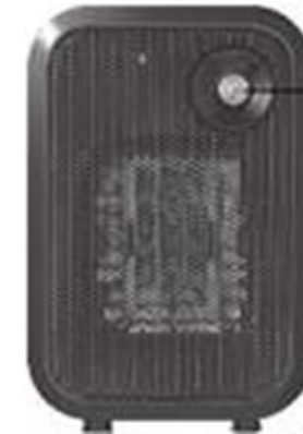
interruptor de alimentación