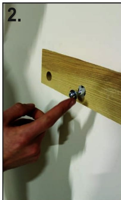
2. Thread the metal screw through the plastic washer until it threads till the wall