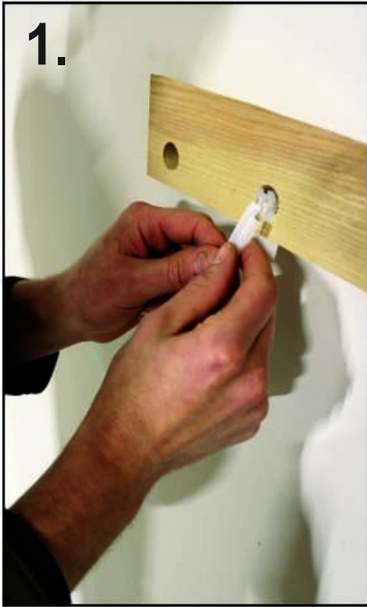
1. Insert the plastic dry wall anchor inside the hole drilled into the wall through the wooden support