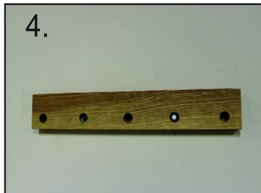
4. Fix all the screws firmly in the 5 slots provided