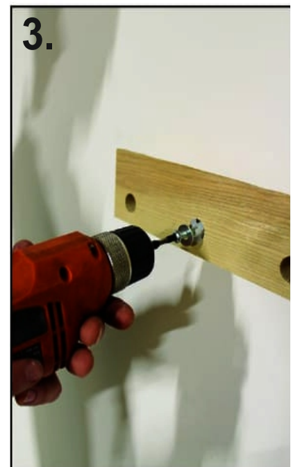
3. Secure the screws tight into the hole drilled in the wall with the help of drill