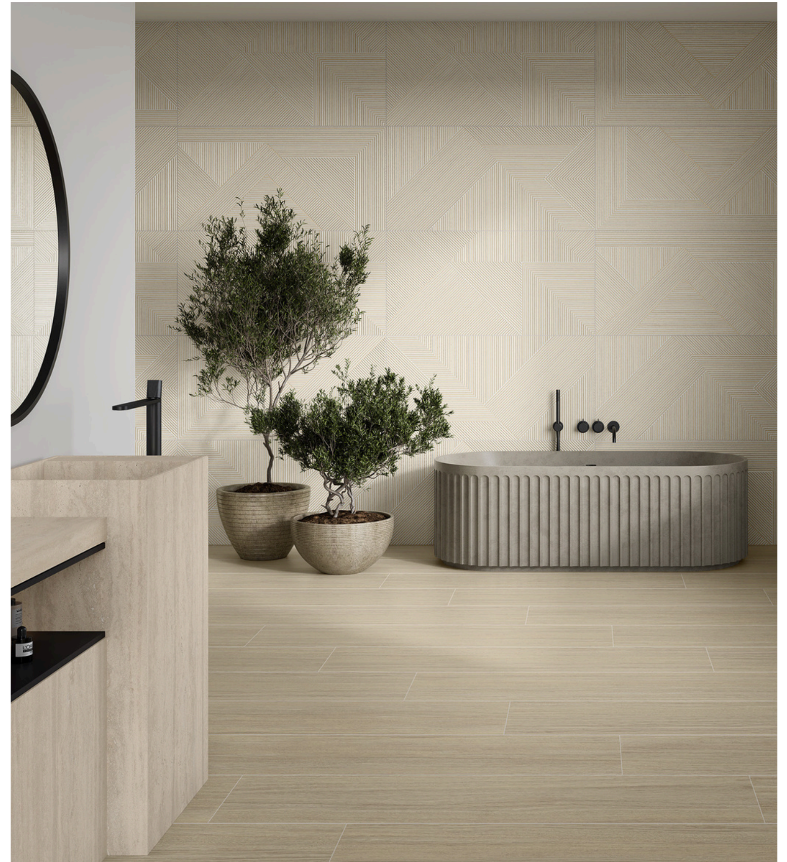
G8813 Nook Ivory 60x120 / 23.42"x47.24"