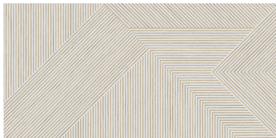
G8813 Nook Ivory 60x120cm / 23.42"x47.24"