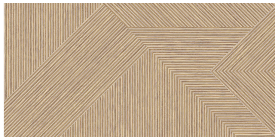
G8812 Nook Beige 60x120cm / 23.42"x47.24"