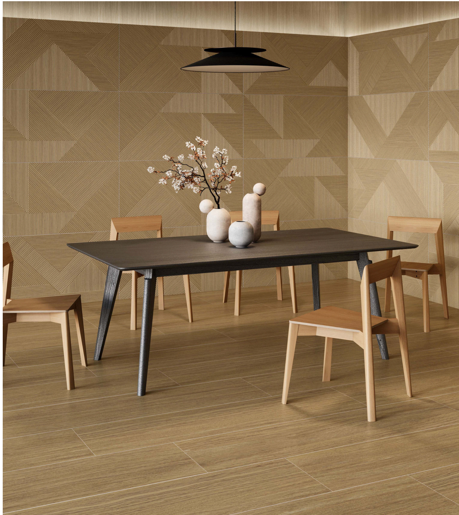
G8812 Nook Beige 60x120 / 23.42"x47.24"