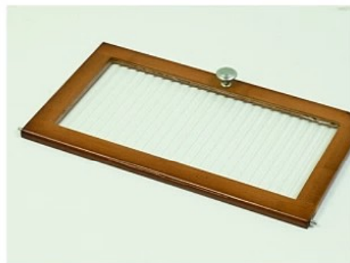
8. 取出门板在门板两端插入门栓