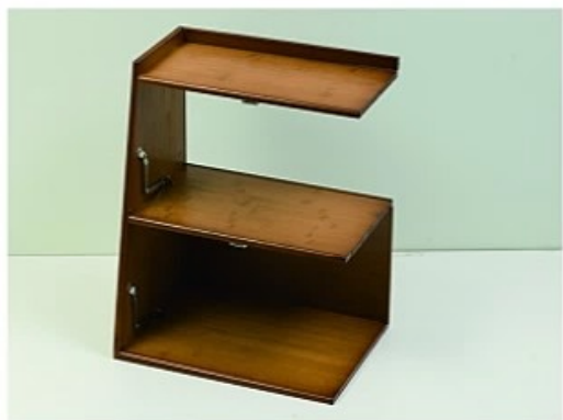
5. 取出背板沿层板凹槽插入