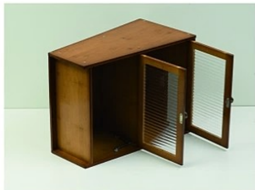
10. 取出侧边支架B用大号螺丝安装