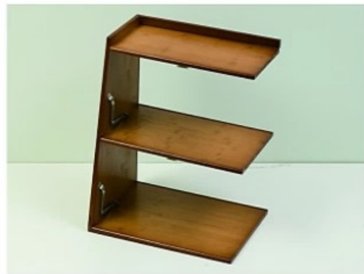
4. 取出后档条用大号螺丝安装