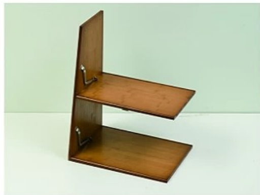
2. 取出中间层板用大号螺丝安装