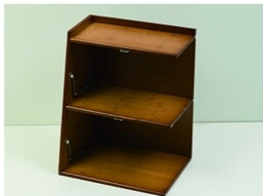
6. 同理插入另外个背板