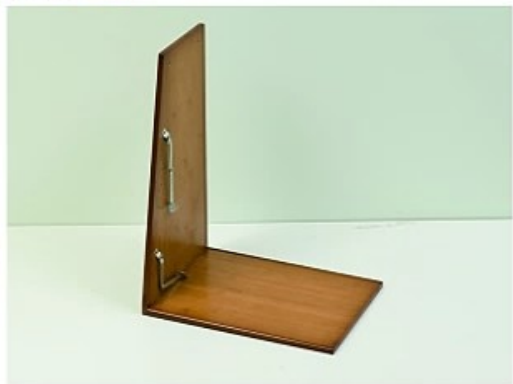
1. 取出底部层板以及侧边支架A用大号螺丝安装 (层板凹槽和支架凹槽对齐)