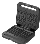
Placa para gofres