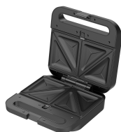
Placa para sándwiches