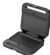
Placa para parrilla