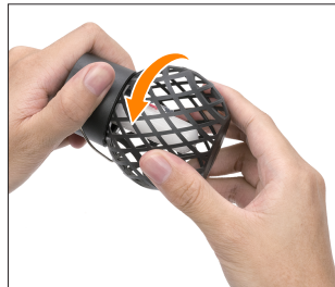
③ Cover the lid.