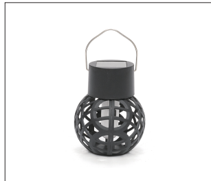
④ Complete the installation.