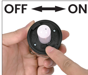
② Remove isolator tab.