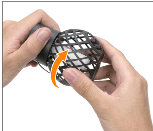
① Gently twist off the lid.