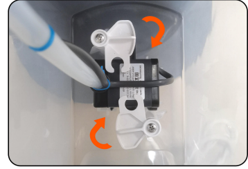
3. Rotate the tablet onto the water pump to secure the water pump