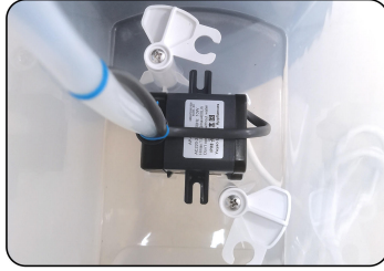
2. Secure the pump to the trough at the bottom of the tank