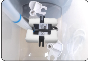
1. Remove the foam around the pump