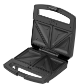
Placa para sándwiches