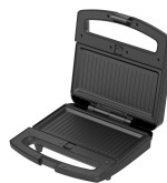
Placa para parrilla