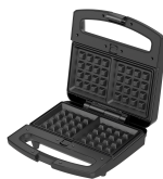
Placa para gofres