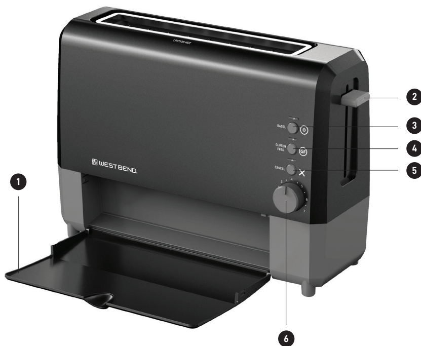
DIAGRAMA DEL PRODUCTO

¡Felicitaciones por la compra de una tostadora West Bend® QuickServe™!