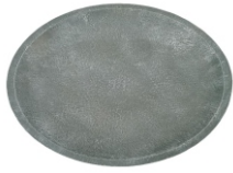
A. Bowl (1x)