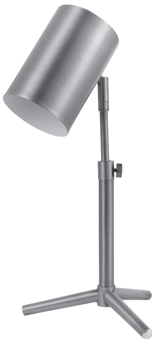
TABLE LAMP LAMPE DE TABLE LÁMPARA DE MESA