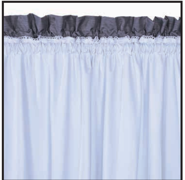
TAILORED PANEL / RIDEAU PASSE TRINGLE