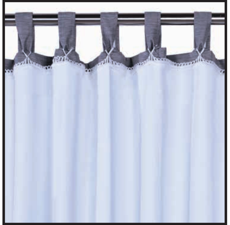
TAB TOP CURTAIN / RIDEAU À LANGUETTES