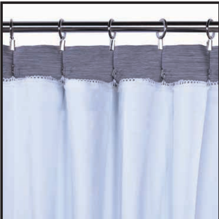
PINCH PLEAT CURTAIN / RIDEAU À PLIS PINCÉS