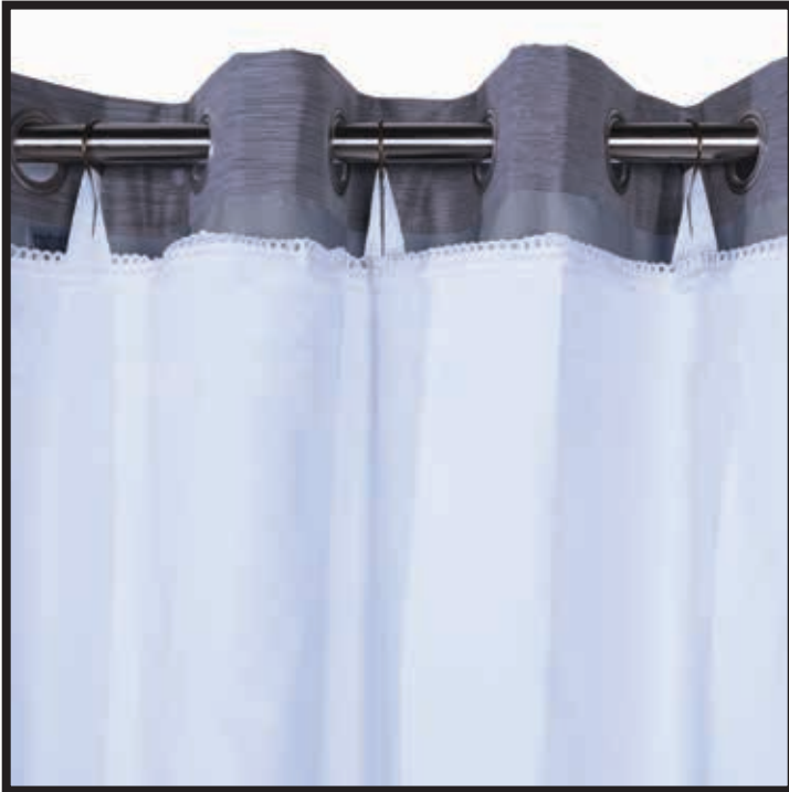
GROMMET CURTAIN / RIDEAU À OEILLETS

Universal construction – accomodates all drapery panel styles Construction universelle – convient à tous les styles de panneaux de rideaux