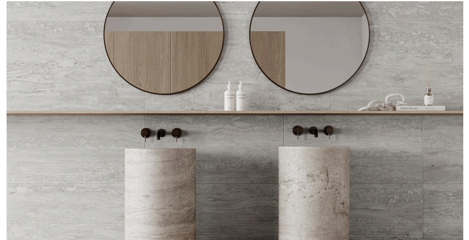
G8022 Marmol Silver 32x62.5cm / 12.6"x24.6" · G8022-D Marmol Deco Silver 32x62.5cm / 12.6"x24.6"