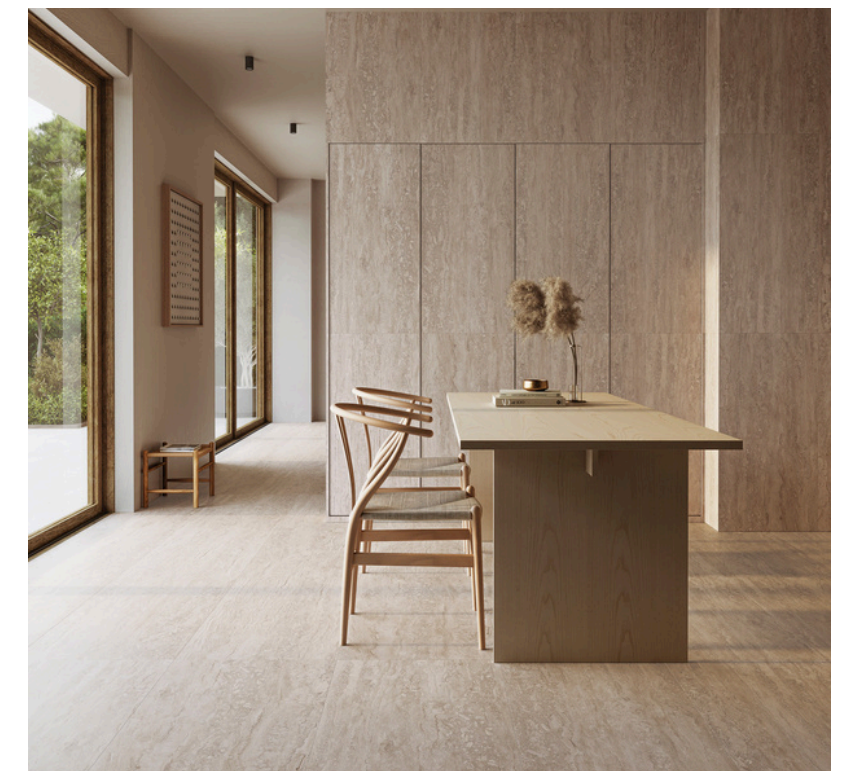
G8021 Marmol Natural 32x62.5cm / 12.6"x24.6"