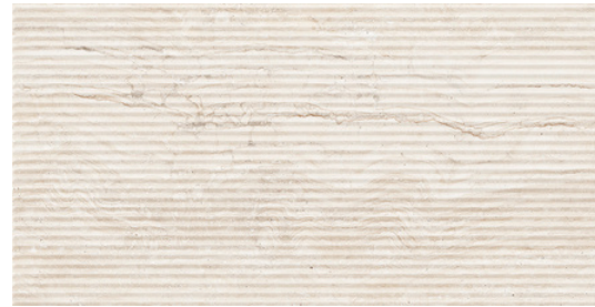
G8020-D Marmol Deco Ivory 32x62.5cm / 12.6"x24.6"