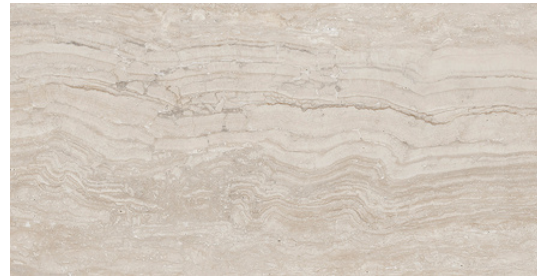
G8021 Marmol Natural 32x62.5cm / 12.6"x24.6"