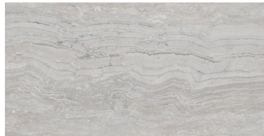
G8022 Marmol Silver 32x62.5cm / 12.6"x24.6"