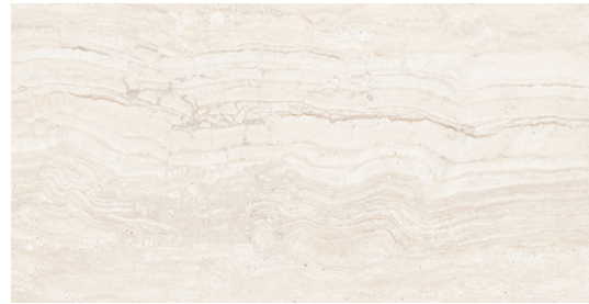
G8020 Marmol Ivory 32x62.5cm / 12.6"x24.6"