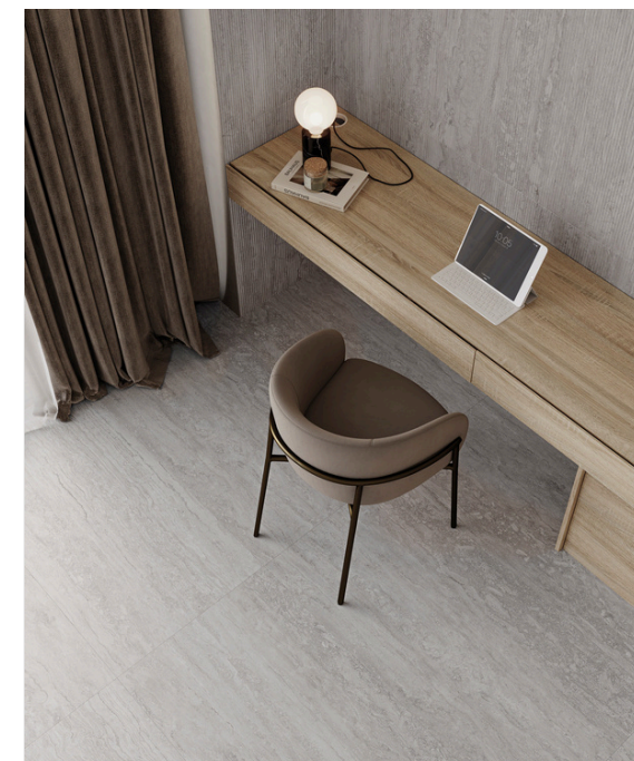
G8022 Marmol Silver 32x62.5cm / 12.6"x24.6" · G8022-D Marmol Deco Silver 32x62.5cm / 12.6"x24.6"