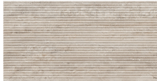
G8021-D Marmol Deco Natural 32x62.5cm / 12.6"x24.6"