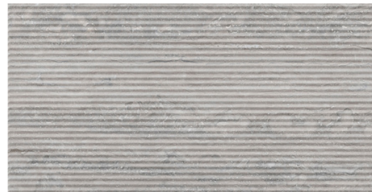
G8022-D Marmol Deco Silver 32x62.5cm / 12.6"x24.6"