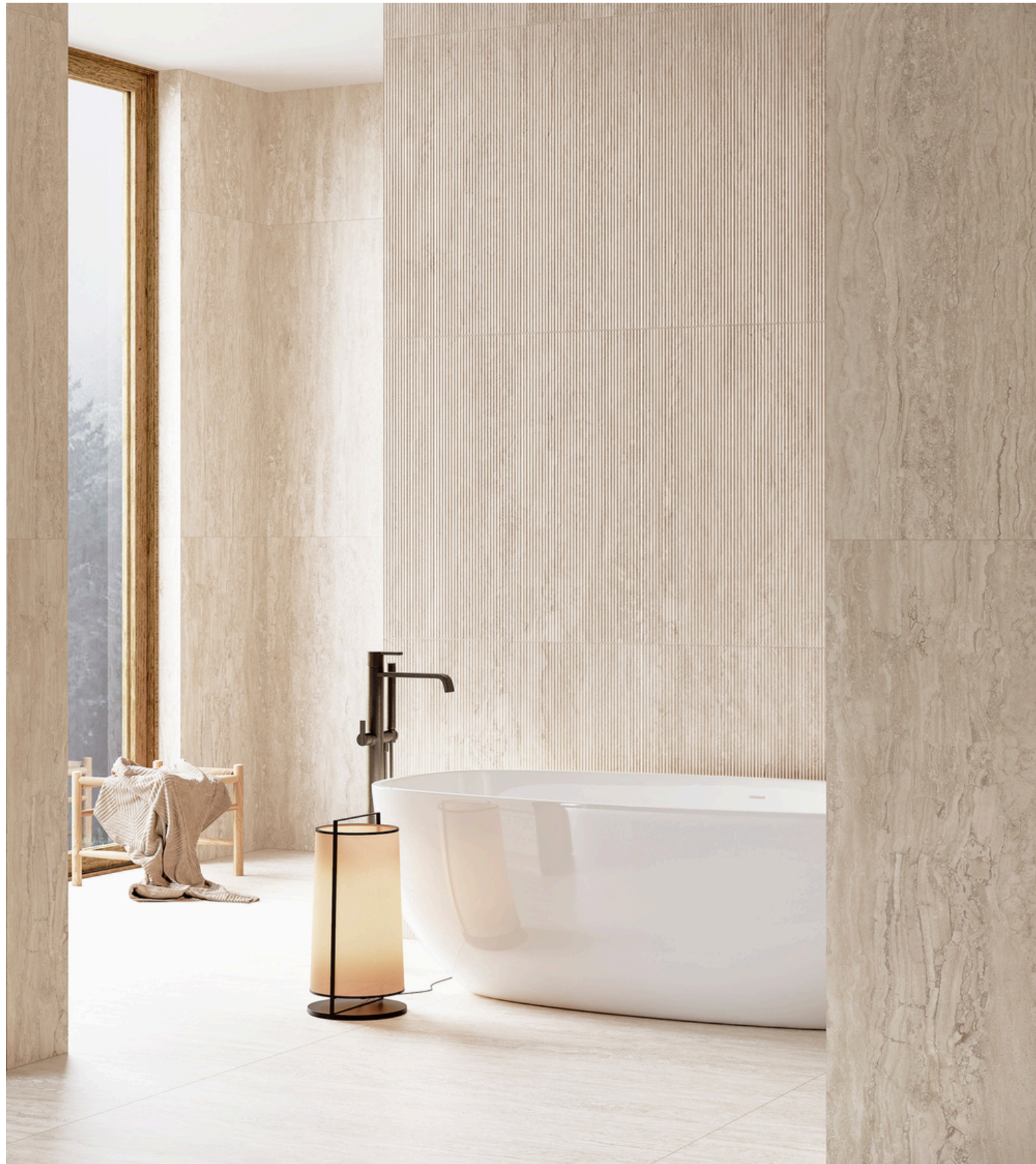
G8020 Marmol Ivory 32x62.5cm / 12.6"x24.6" · G8020-D Marmol Deco Ivory 32x62.5cm / 12.6"x24.6"